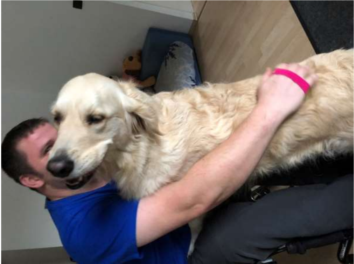
Die Massagen sind auch immer ganz toll.