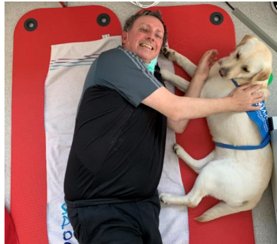
bei der Ergotherapie