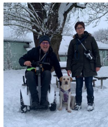
unsere erste Begegnung