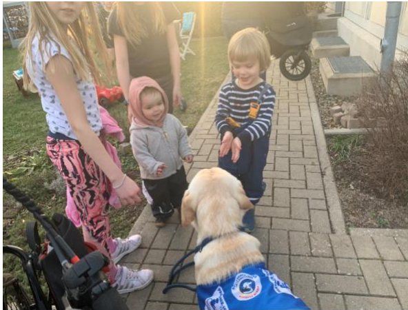
die Kinder in der Nachbarschaft

Der Übergang in das „Alltägliche“ hat nahezu reibungslos funktioniert. In der unmittelbaren Nachbarschaft ( www.poestenhof.de ), auf der Arbeit, und zuhause, so als wären wir schon immer ein Team: